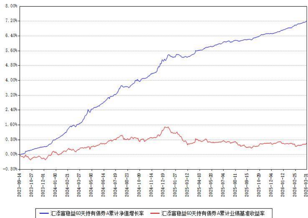
汇添富稳益60天持有债券A累计净值增长率与同期业绩比较基准收益率对比图