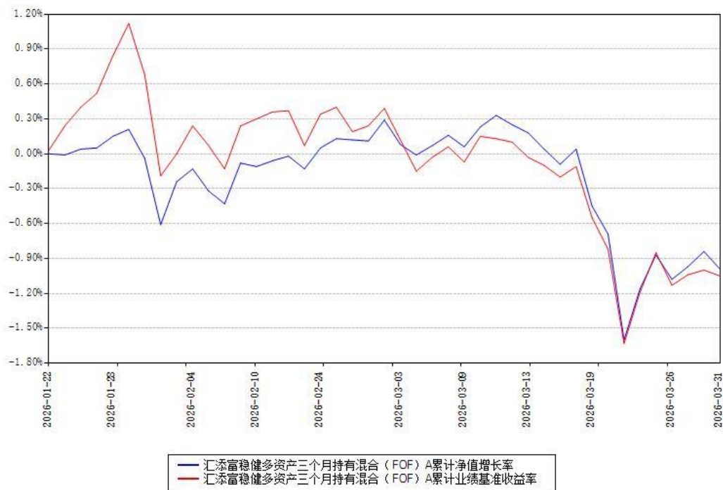
汇添富稳健多资产三个月持有混合（FOF）C累计净值增长率与同期业绩基准收益率对比图