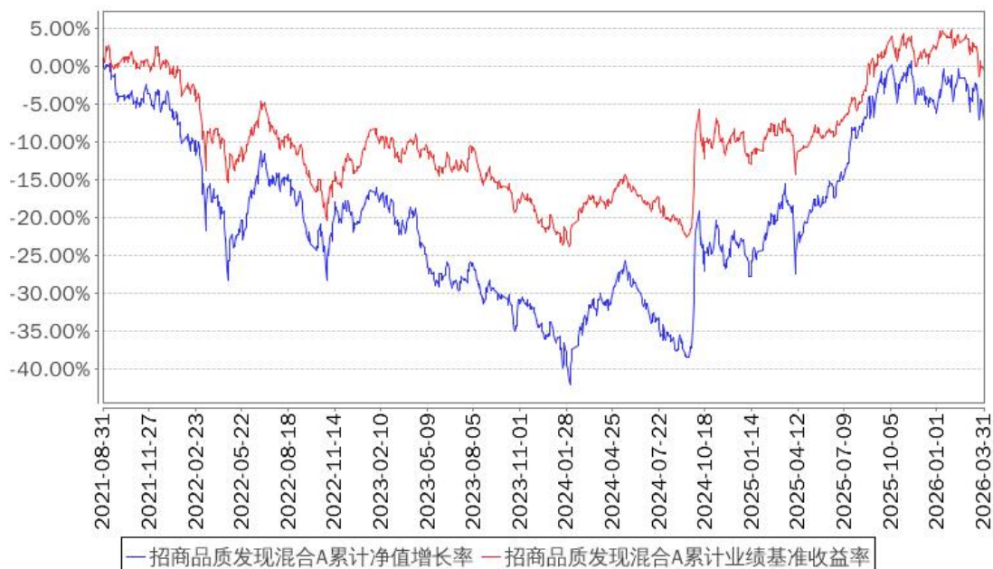
招商品质发现混合A累计净值增长率与同期业绩比较基准收益率的历史走势对比图