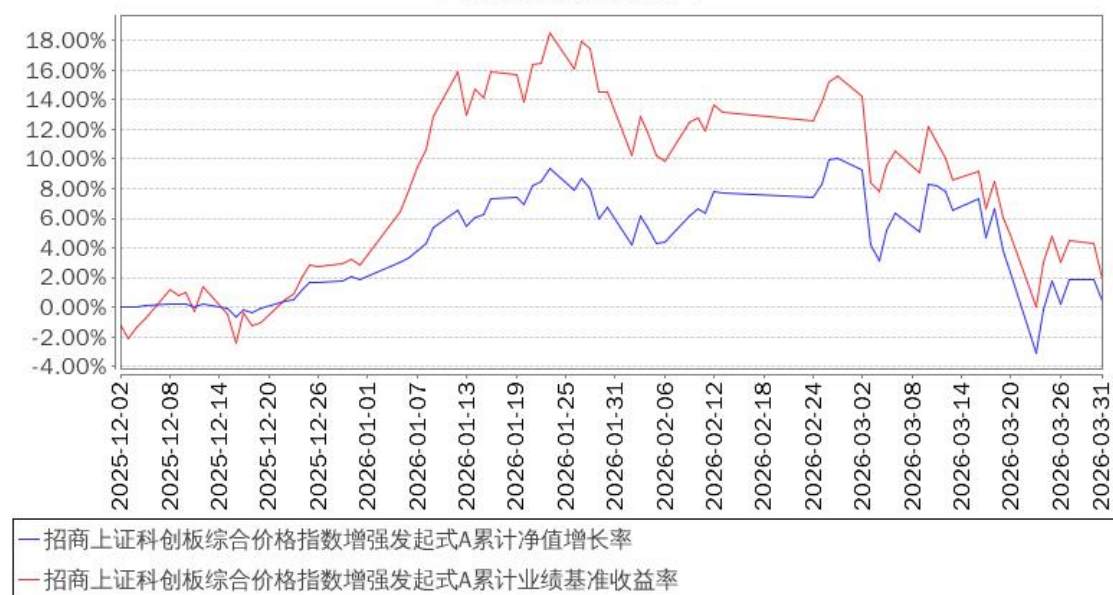
招商上证科创板综合价格指数增强发起式A累计净值增长率与同期业绩比较基准收益率的历史走势对比图