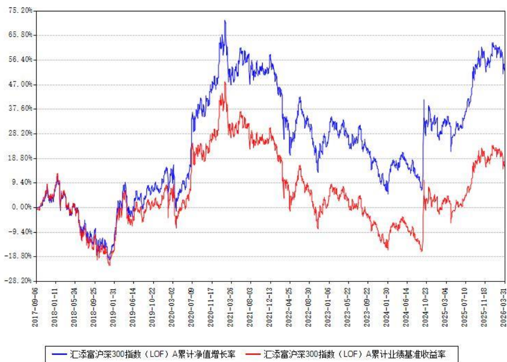
汇添富沪深300指数 (LOF) A 累计净值增长率与同期业绩比较基准收益率对比图