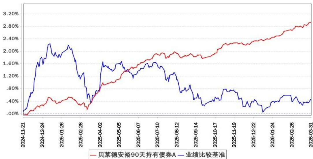
贝莱德安裕90天持有债券A累计净值增长率与同期业绩比较基准收益率的历史走势对比图