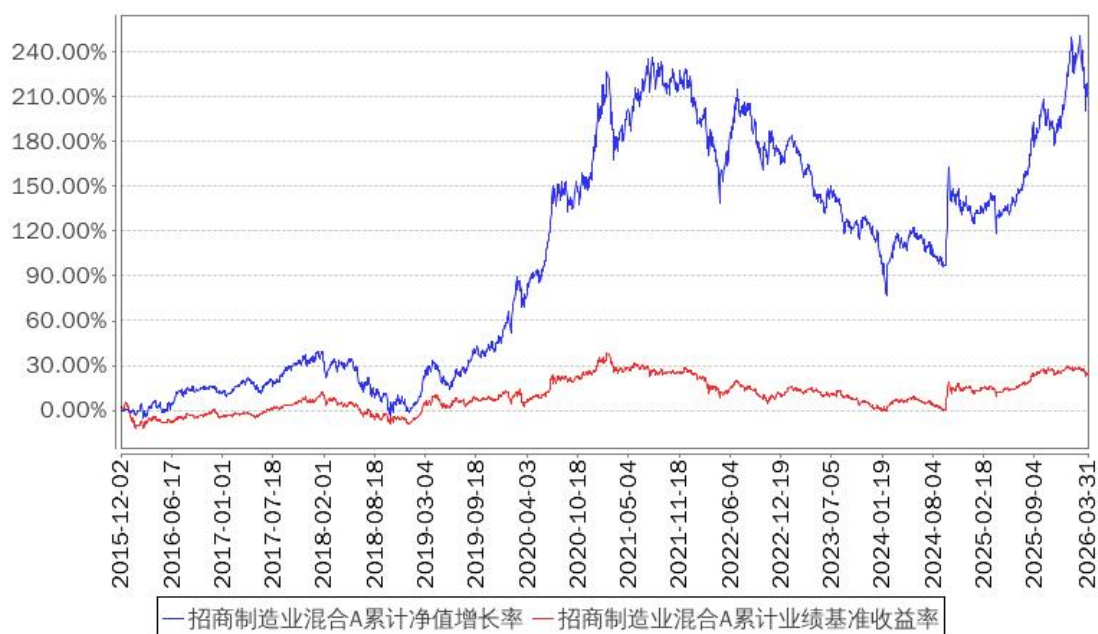
招商制造业混合A累计净值增长率与同期业绩比较基准收益率的历史走势对比图