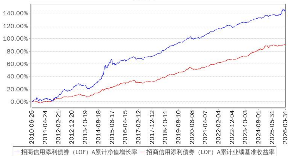
招商信用添利债券 (LOF) A累计净值增长率与同期业绩比较基准收益率的历史走势对比图