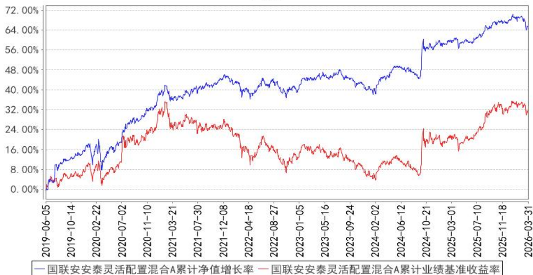
国联安安泰灵活配置混合A累计净值增长率与同期业绩比较基准收益率的历史走势对比图

注：1、国联安安泰灵活配置混合型证券投资基金于 2025 年 7 月 17 日起增加收取销售服务费的 C 类基金份额，并对本基金基金合同及托管协议作相应修改，原有的基金份额在增加收取销售服务费的 C 类基金份额后，全部自动转换为国联安安泰灵活配置混合型证券投资基金 A 类份额；