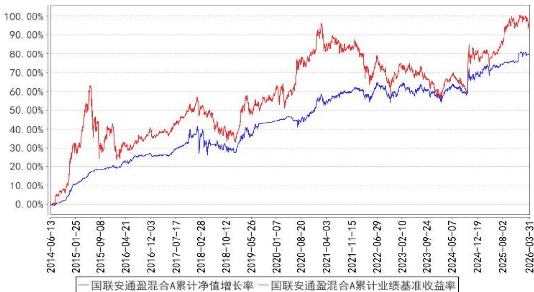
国联安通盈混合A累计净值增长率与同期业绩比较基准收益率的历史走势对比图

注：1、国联安通盈灵活配置混合型证券投资基金于 2016 年 3 月 2 日起增加收取销售服务费的 C 类基金份额，并对本基金基金合同作相应修改，原有的基金份额在开放申购赎回后，全部转换为国联安通盈灵活配置混合 A 类份额；