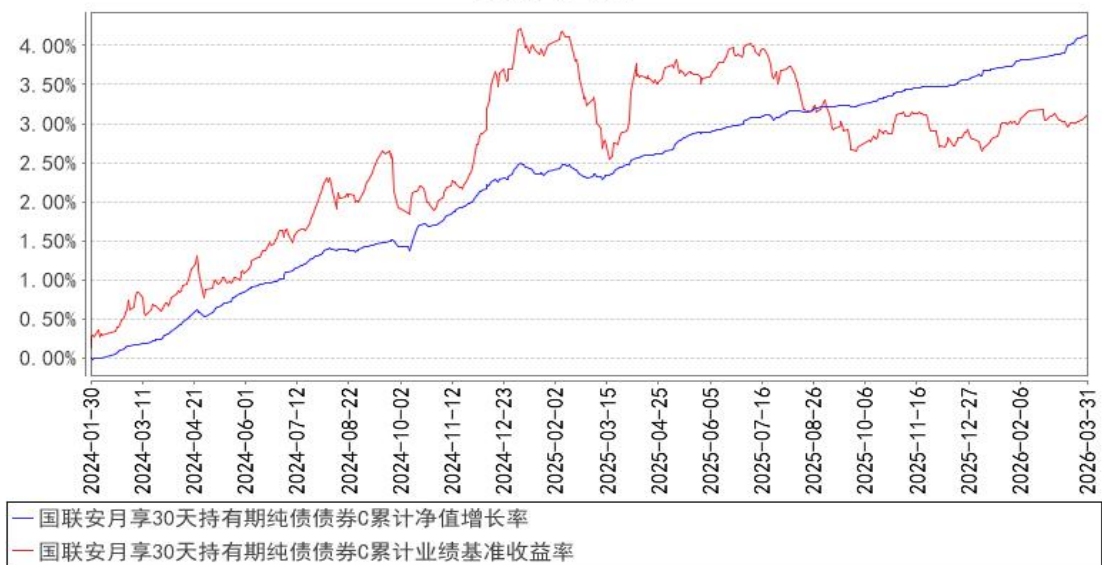
国联安月享30天持有期纯债债券C累计净值增长率与同期业绩比较基准收益率的历史走势对比图