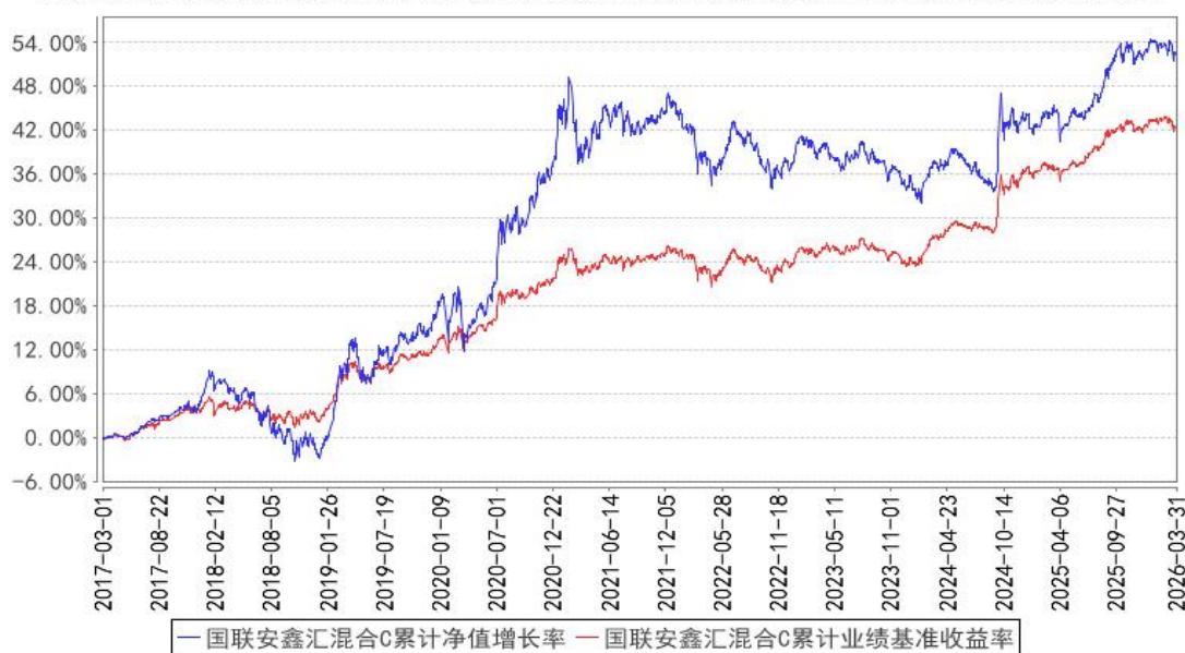
国联安鑫汇混合C累计净值增长率与同期业绩比较基准收益率的历史走势对比图

注：1、本基金业绩比较基准为：沪深 300 指数收益率×20%+上证国债指数收益率×80%；