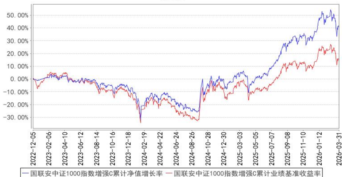
国联安中证1000指数增强C累计净值增长率与同期业绩比较基准收益率的历史走势对比图