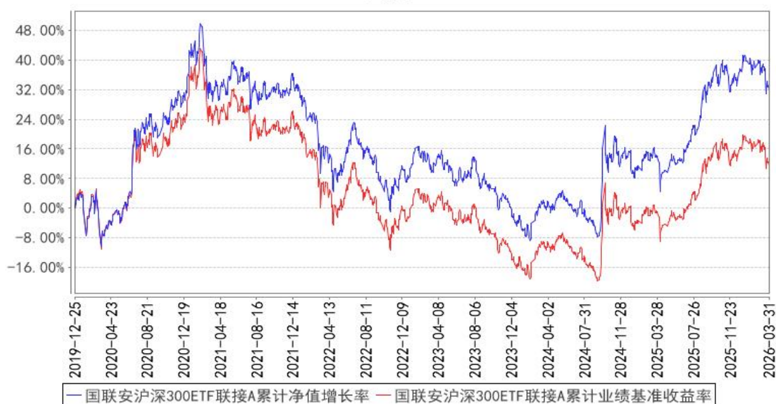
国联安沪深300ETF联接A累计净值增长率与同期业绩比较基准收益率的历史走势对比图

注：1、本基金业绩比较基准为沪深 300 指数收益率×95%+银行活期存款利率（税后）×5%； 2、本基金基金合同于 2019 年 12 月 25 日生效； 3、本基金建仓期为自基金合同生效之日起的 6 个月。建仓期结束时各项资产配置符合合同约定。