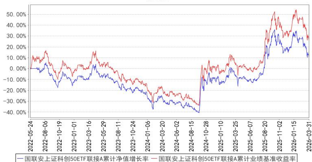
国联上证科创板50ETF联接A累计净值增长率与同期业绩比较基准收益率的历史走势对比图

注：1、本基金业绩比较基准为上证科创板 50 成份指数收益率*95%+银行活期存款利率(税后)*5%； 2、本基金基金合同于 2022 年 5 月 24 日生效； 3、本基金建仓期为自基金合同生效之日起的 6 个月，建仓期结束时各项资产配置符合合同约定。