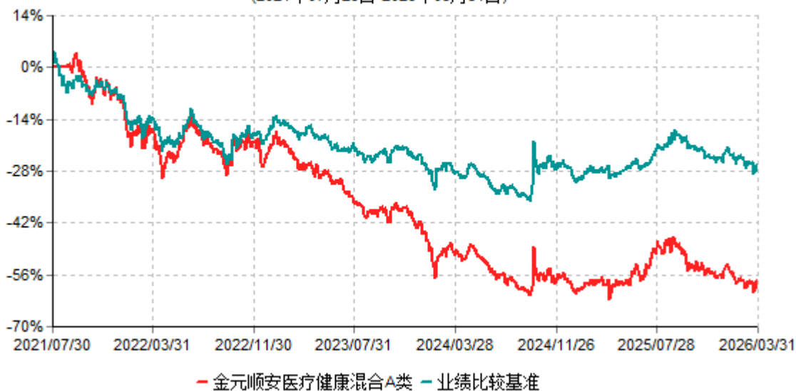
金元顺安医疗健康混合A类累计净值增长率与业绩比较基准收益率历史走势对比图 (2021年07月29日-2026年03月31日)