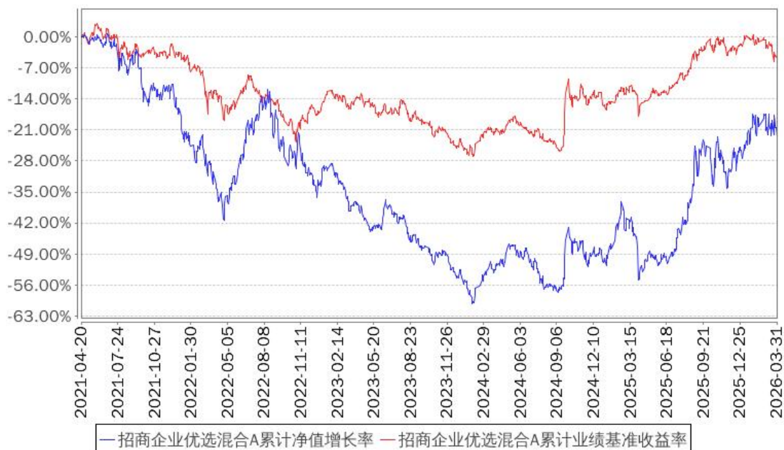
招商企业优选混合A累计净值增长率与同期业绩比较基准收益率的历史走势对比图