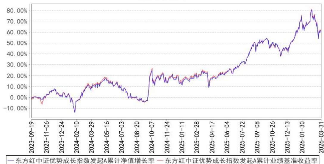
东方红中证优势成长指数发起A累计净值增长率与同期业绩比较基准收益率的历史走势对比图