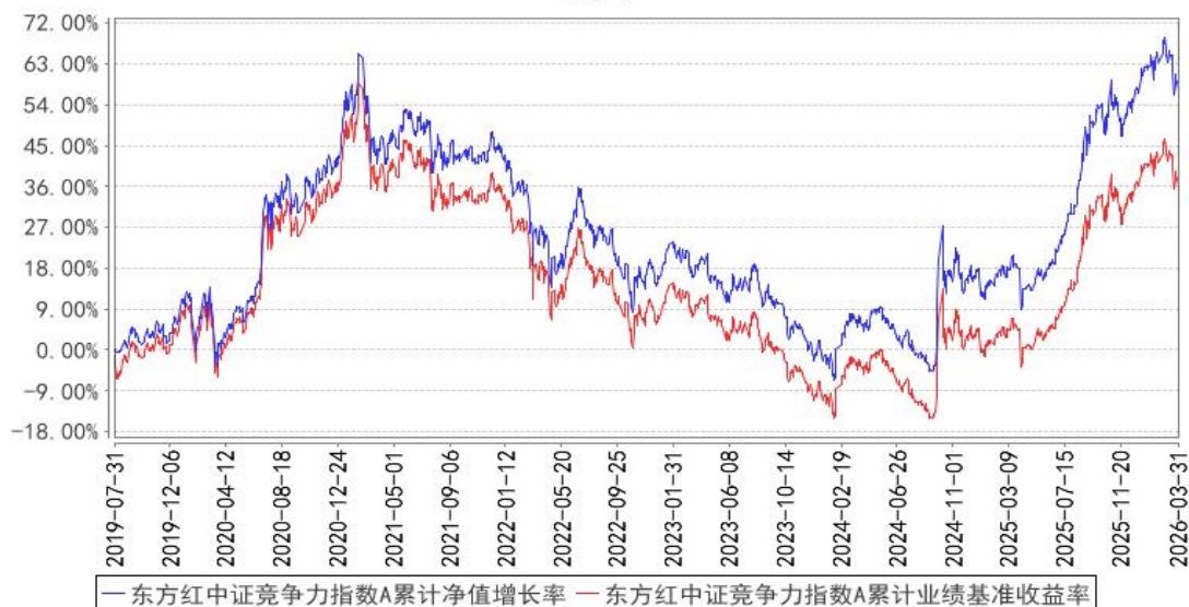
东方红中证竞争力指数A累计净值增长率与同期业绩比较基准收益率的历史走势对比图