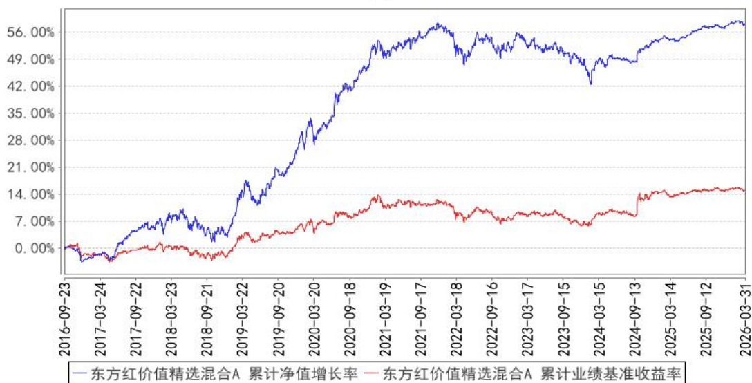
东方红价值精选混合A 累计净值增长率与同期业绩比较基准收益率的历史走势对比图