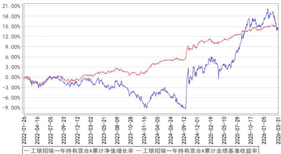
工银招瑞一年持有混合A累计净值增长率与同期业绩比较基准收益率的历史走势对比图