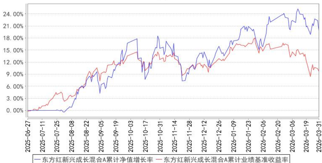
东方红新兴成长混合A累计净值增长率与同期业绩比较基准收益率的历史走势对比图