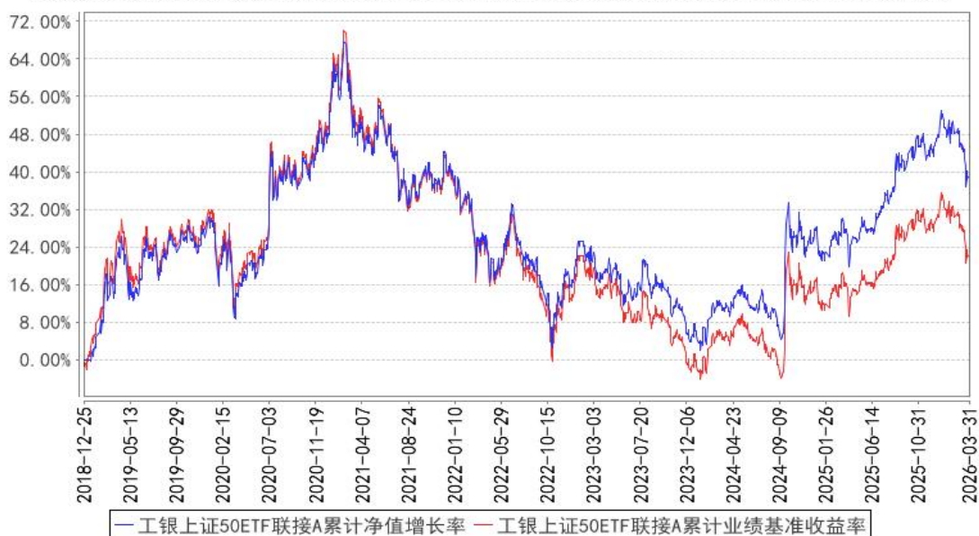
工银上证50ETF联接A累计净值增长率与同期业绩比较基准收益率的历史走势对比图