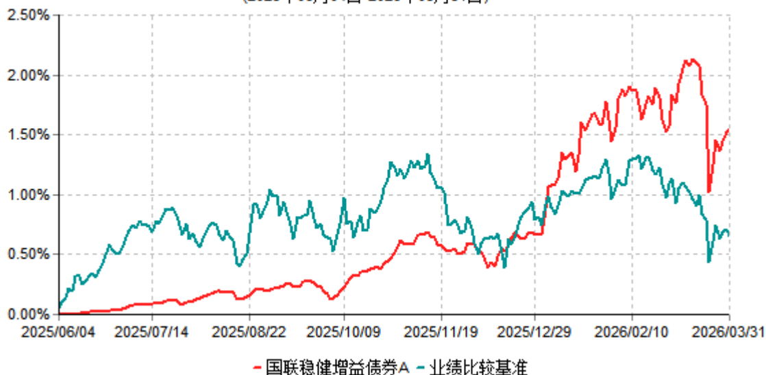
国联稳健增益债券A累计净值增长率与业绩比较基准收益率历史走势对比图 (2025年06月04日-2026年03月31日)