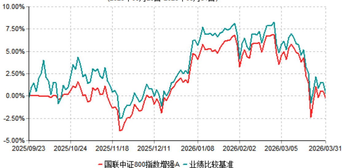
国联中证800指数增强A累计净值增长率与业绩比较基准收益率历史走势对比图 (2025年09月23日-2026年03月31日)