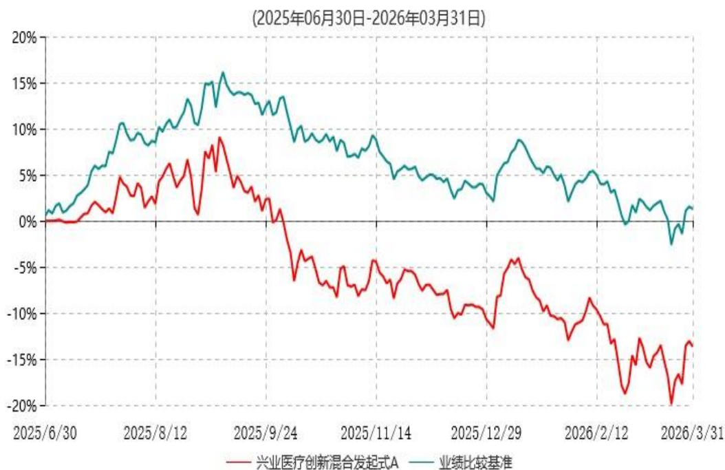
兴业医疗创新混合发起式A累计净值增长率与业绩比较基准收益率历史走势对比图