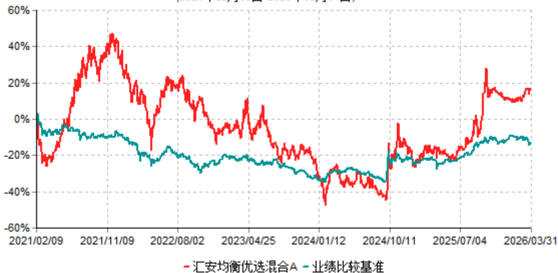
汇安均衡优选混合A累计净值增长率与业绩比较基准收益率历史走势对比图 (2021年02月09日-2026年03月31日)