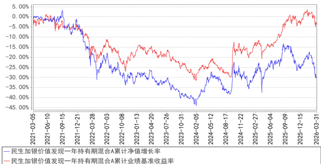
民生加银价值发现一年持有期混合A累计净值增长率与同期业绩比较基准收益率的历史走势对比图