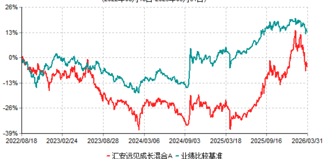
汇安远见成长混合A累计净值增长率与业绩比较基准收益率历史走势对比图 (2022年08月18日-2026年03月31日)