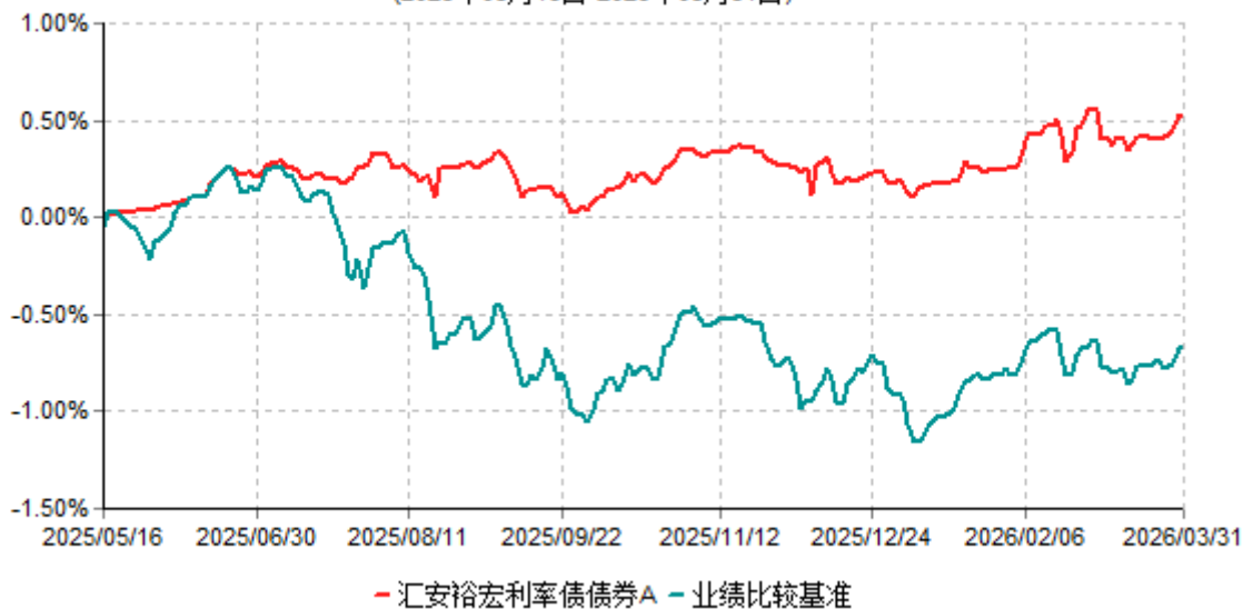
汇安裕宏利率债债券A累计净值增长率与业绩比较基准收益率历史走势对比图 (2025年05月16日-2026年03月31日)