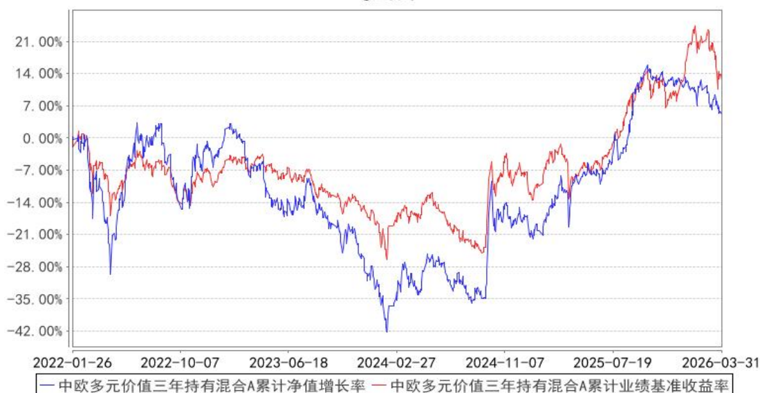
中欧多元价值三年持有混合A累计净值增长率与同期业绩比较基准收益率的历史走势对比图