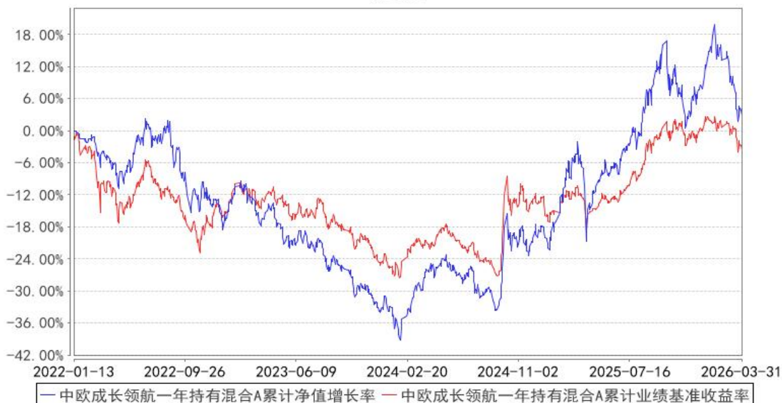
中欧成长领航一年持有混合A累计净值增长率与同期业绩比较基准收益率的历史走势对比图