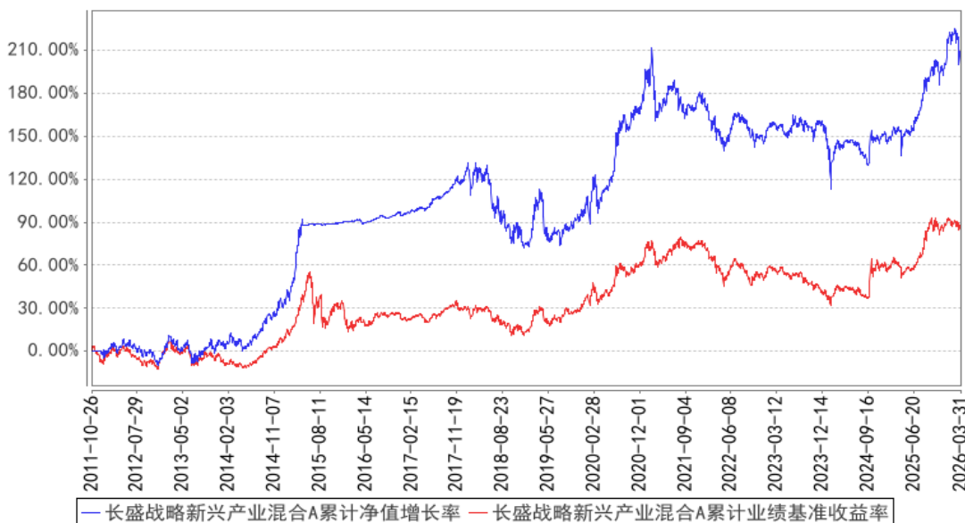
长盛战略新兴产业混合A累计净值增长率与同期业绩比较基准收益率的历史走势对比图