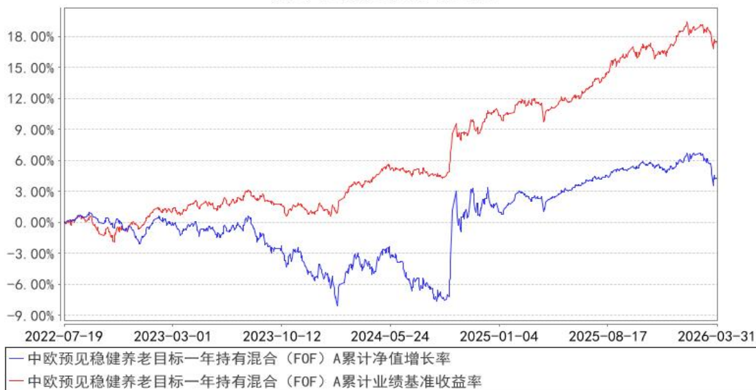
中欧预见稳健养老目标一年持有混合（FOF）A 累计净值增长率与同期业绩比较基准收益率的历史走势对比图

注：2025 年 1 月 27 日起组合业绩比较基准变更为中证债券型基金指数收益率*80%+中证 800 指数收益率*15%+中证港股通综合指数(人民币)收益率*3%+中证商品期货成份指数收益率*2%。