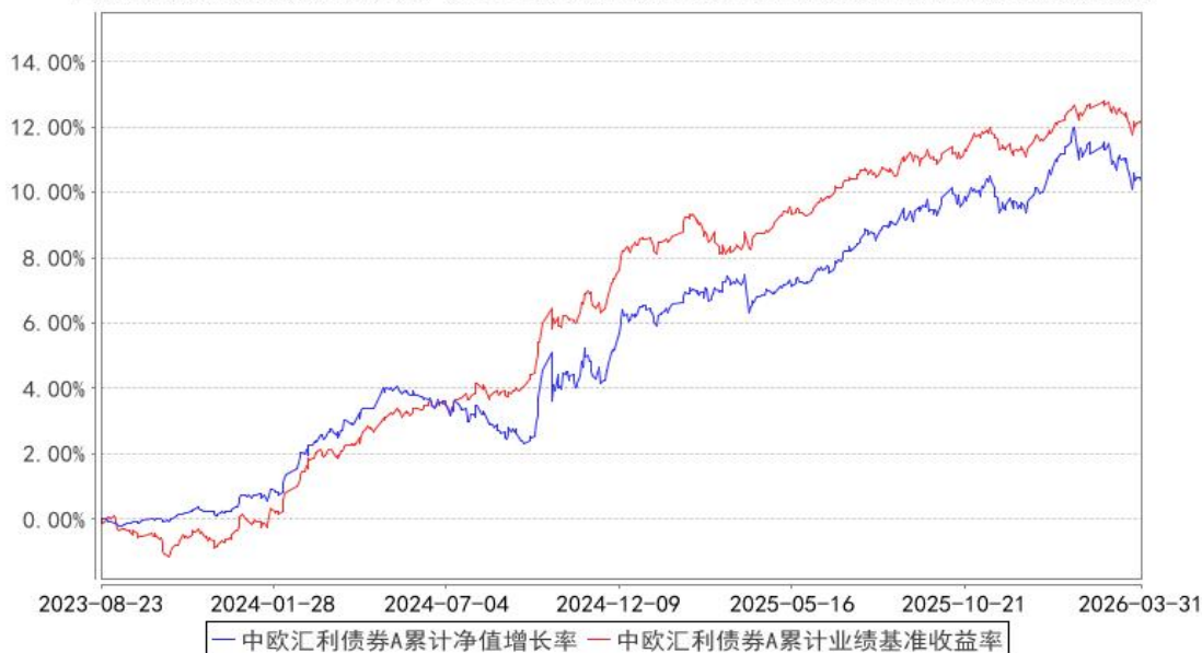
中欧汇利债券A累计净值增长率与同期业绩比较基准收益率的历史走势对比图