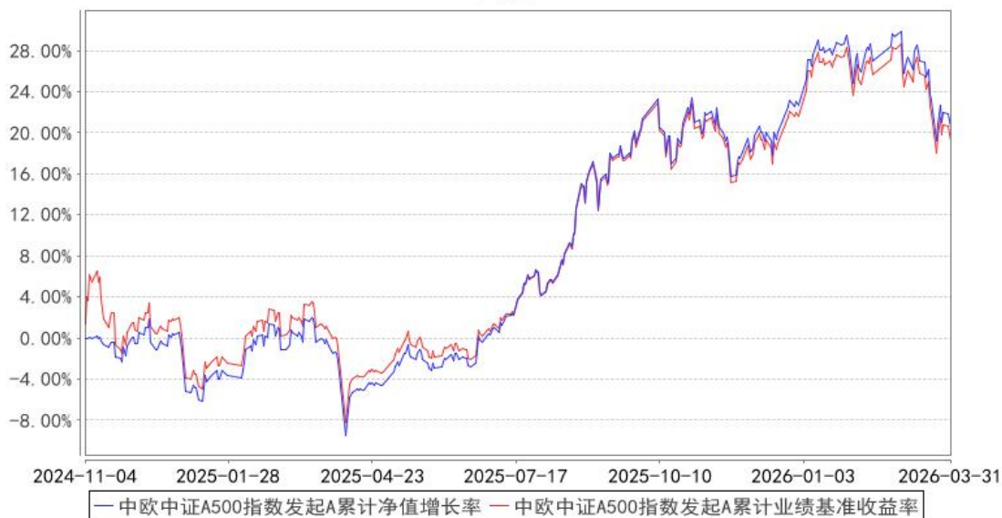
中欧中证A500指数发起A累计净值增长率与同期业绩比较基准收益率的历史走势对比图

注：本基金基金合同生效日期为 2024 年 11 月 4 日，按基金合同的规定，本基金自基金合同生效起六个月为建仓期，建仓期结束时各项资产配置比例已经符合基金合同约定。