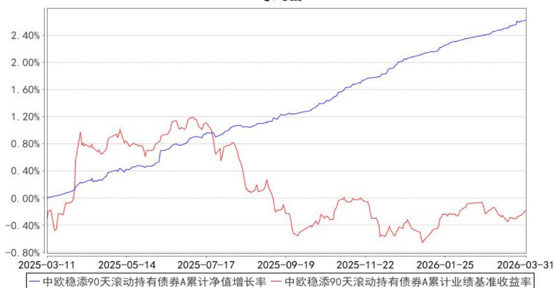
中欧稳添90天滚动持有债券A累计净值增长率与同期业绩比较基准收益率的历史走势对比图

注：本基金基金合同生效日期为 2025 年 3 月 11 日，自基金合同生效日起到本报告期末不满一年，按基金合同的规定，本基金自基金合同生效起六个月为建仓期，建仓期结束时各项资产配置比例已经符合基金合同约定。