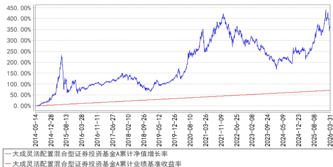
大成灵活配置混合型证券投资基金A累计净值增长率与同期业绩比较基准收益率的历史走势对比图