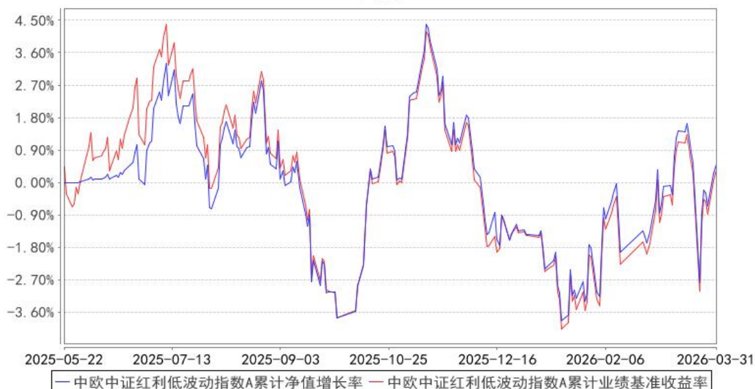
中欧中证红利低波动指数A累计净值增长率与同期业绩比较基准收益率的历史走势对比图

注：本基金基金合同生效日期为 2025 年 5 月 22 日，自基金合同生效日起到本报告期末不满一年，按基金合同的规定，本基金自基金合同生效起六个月为建仓期，建仓期结束时各项资产配置比例已经符合基金合同约定。