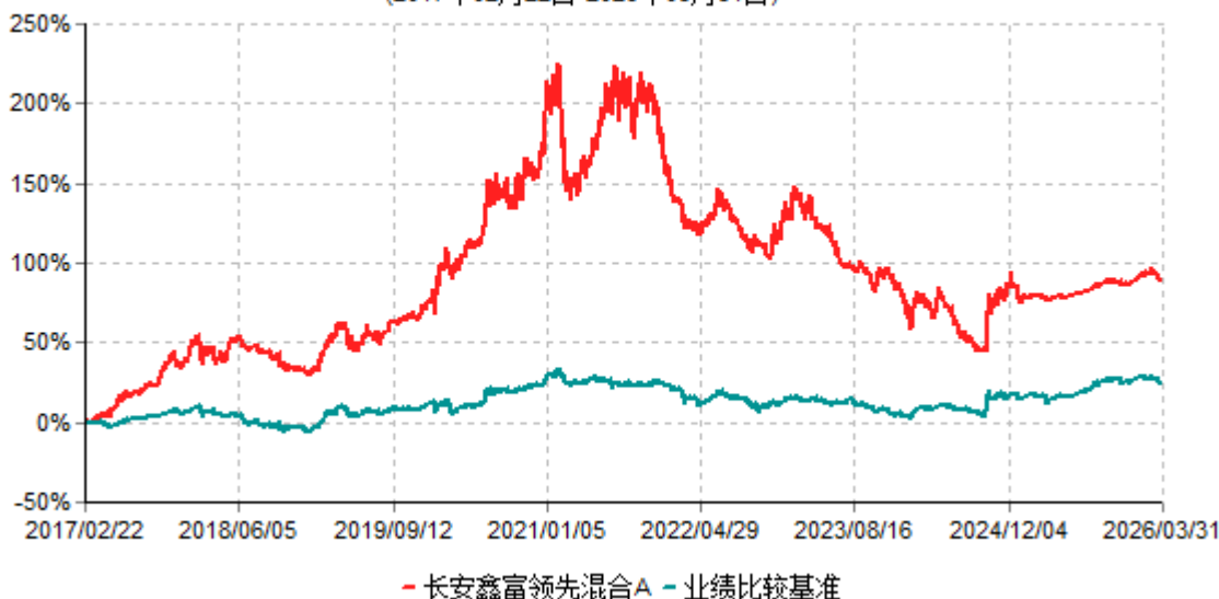
长安鑫富领先混合A累计净值增长率与业绩比较基准收益率历史走势对比图 (2017年02月22日-2026年03月31日)

根据基金合同的规定,自基金合同生效之日起 6 个月内基金各项资产配置比例需符合基金合同要求。本基金在建仓期结束后,各项资产配置比例已符合基金合同有关投资比例的约定。基金合同生效日至报告期期末,本基金运作时间超过一年。图示日期为 2017 年 2 月 22 日至 2026 年 3 月 31 日。