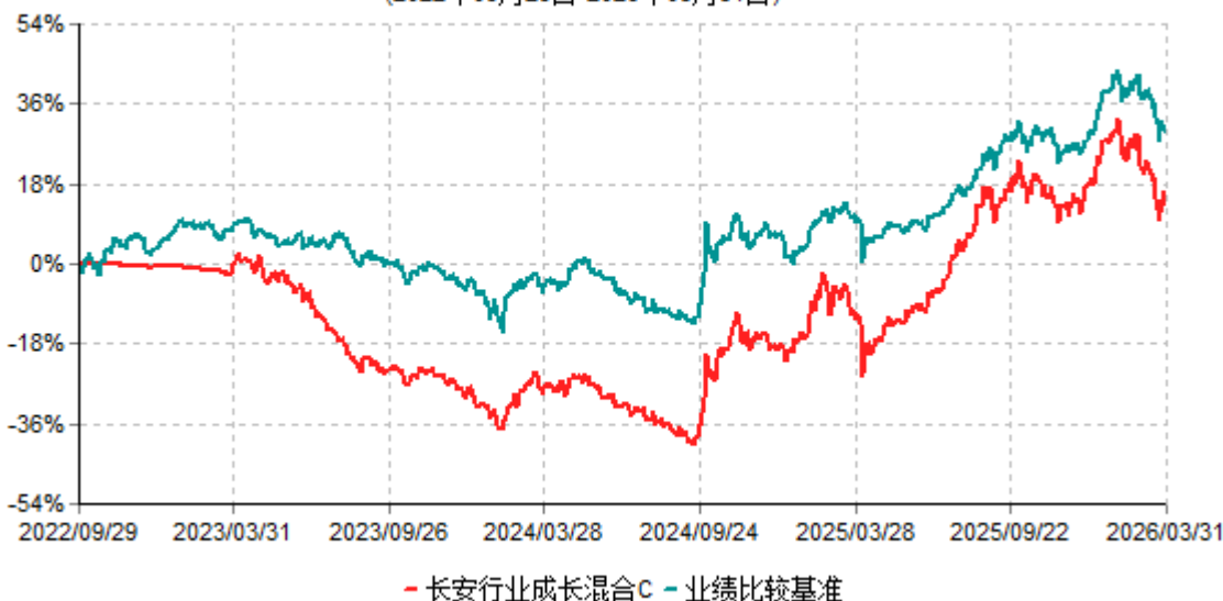
长安行业成长混合C累计净值增长率与业绩比较基准收益率历史走势对比图 (2022年09月29日-2026年03月31日)

根据基金合同的规定,自基金合同生效之日起6个月内基金各项资产配置比例需符合基金合同要求。本基金在建仓期结束后,各项资产配置比例已符合基金合同有关投资比例的约定。本基金于2022年9月29日成立,基金合同生效日至报告期末,本基金运作时间已满一年。图示日期为2022年9月29日至2026年3月31日。