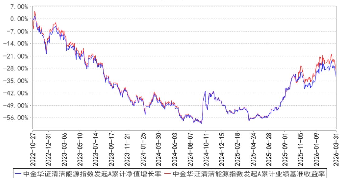
中金华证清洁能源指数发起A累计净值增长率与同期业绩比较基准收益率的历史走势对比图