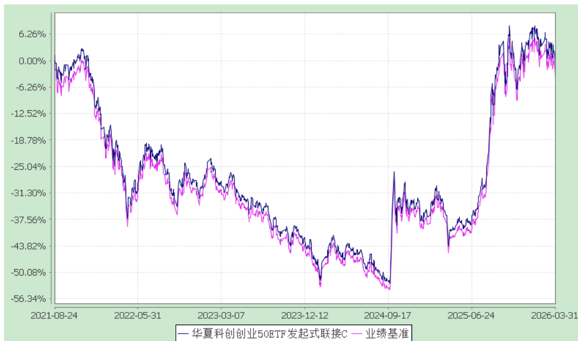
华夏科创创业 50ETF 发起式联接 Y: