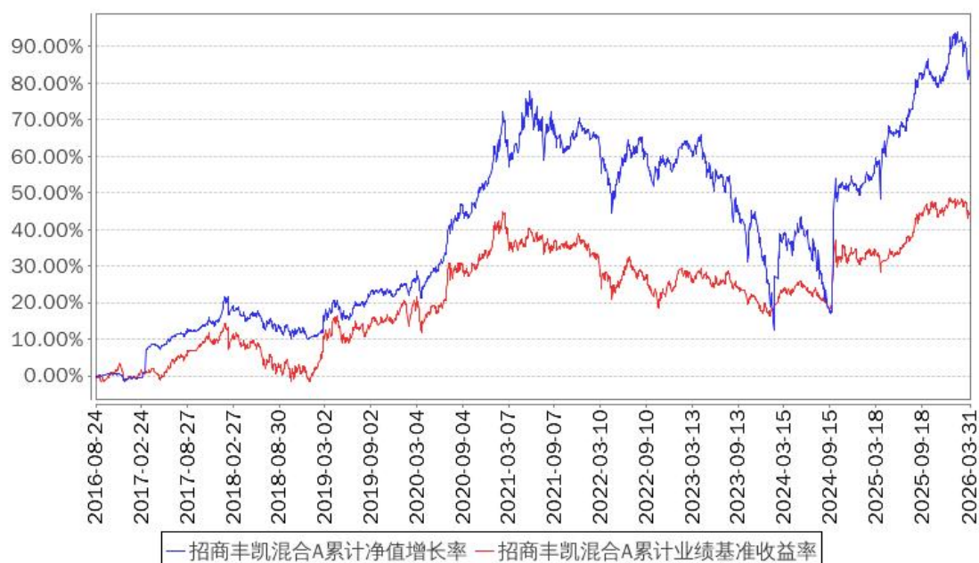
招商丰凯混合A累计净值增长率与同期业绩比较基准收益率的历史走势对比图