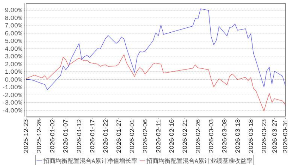
招商均衡配置混合A累计净值增长率与同期业绩比较基准收益率的历史走势对比图