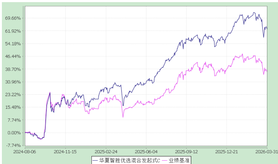
华夏智胜优选混合发起式 D: