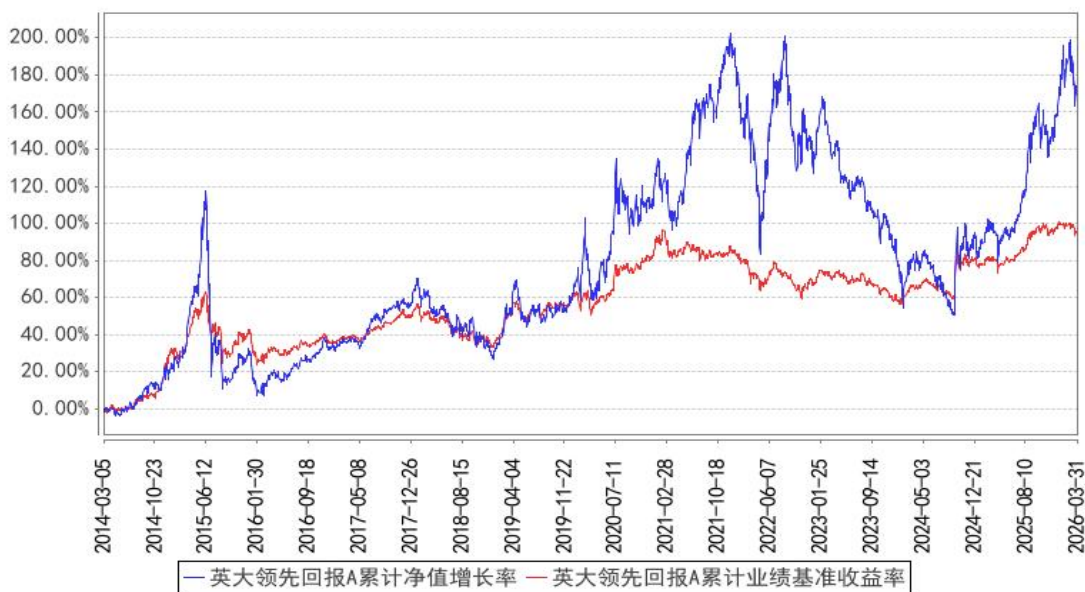
英大领先回报A累计净值增长率与同期业绩比较基准收益率的历史走势对比图