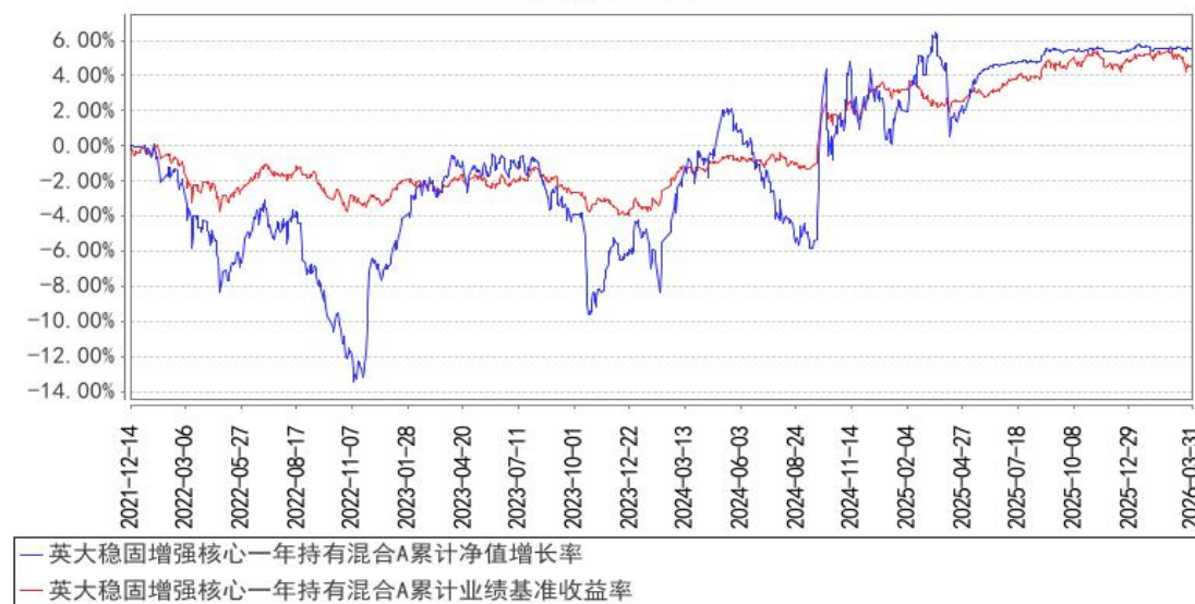
英大稳固增强核心一年持有混合A累计净值增长率与同期业绩比较基准收益率的历史走势对比图