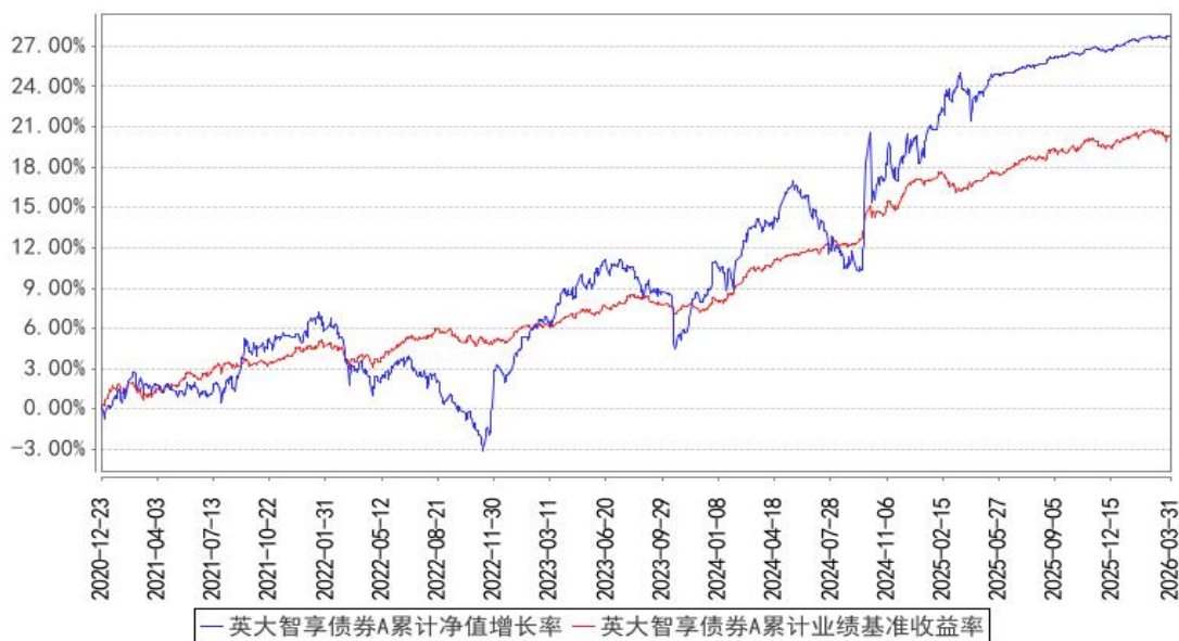
英大智享债券A累计净值增长率与同期业绩比较基准收益率的历史走势对比图