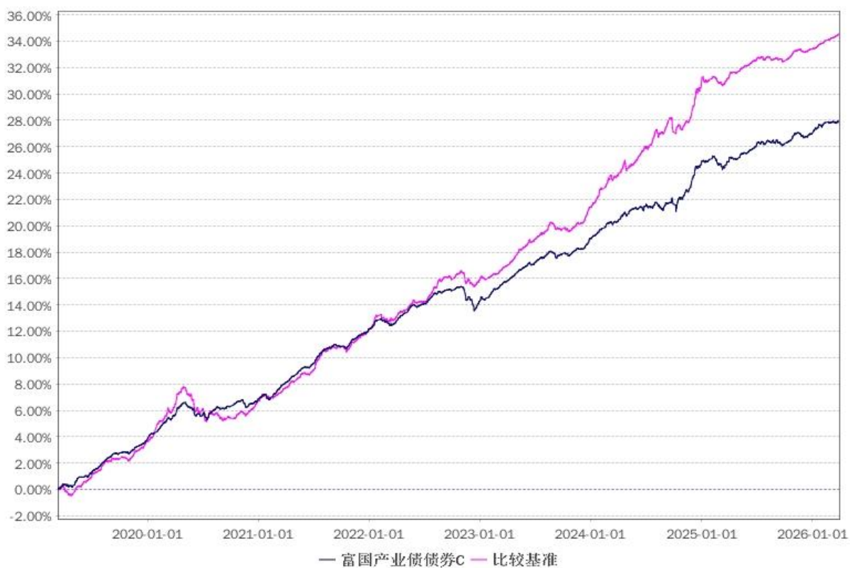
率的历史走势对比图